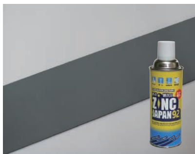
ZINC JAPAN 92 で防錆処理