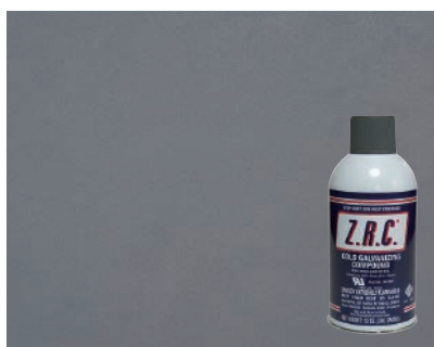
常温亜鉛めっき Z.R.C. で防錆処理