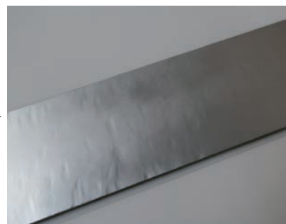
ZINC JAPAN 92 の上に めっき艶グロスで色合わせ