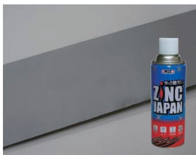
ZINC JAPAN で防錆処理