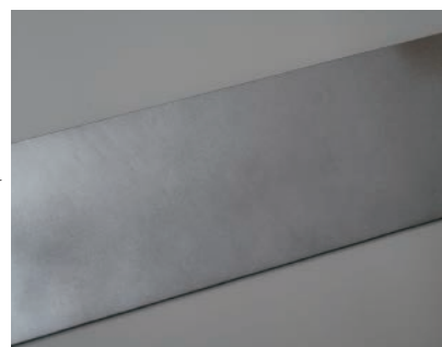
ZINC JAPAN の上に めっき艶グロスで色合わせ